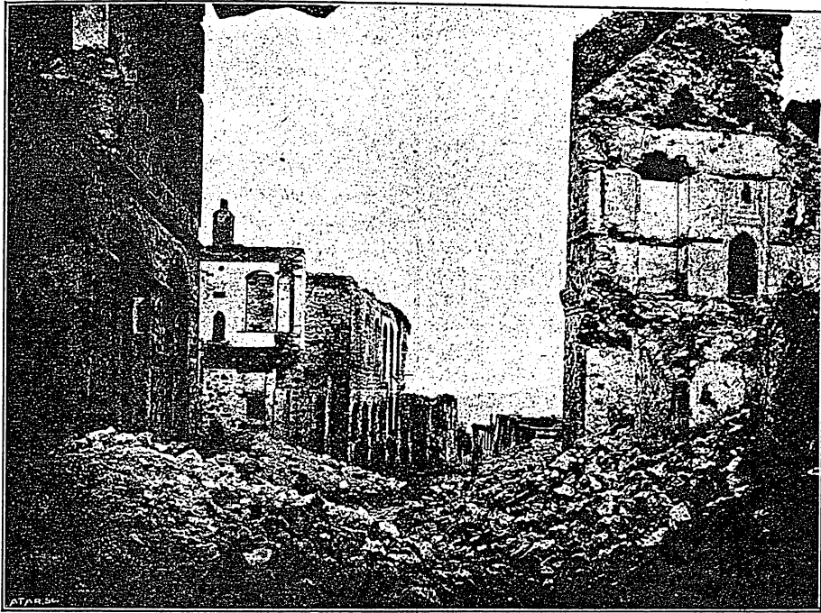
Շուշու հրդեհը—հայոց բազարի շուքը: