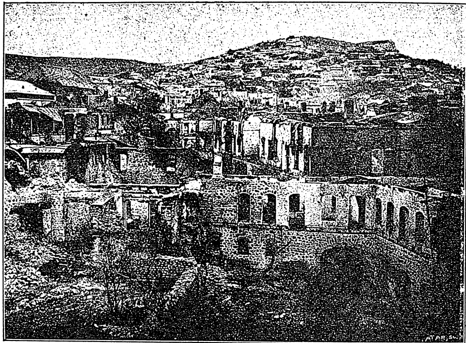
Շուշու հայոց Թաղի հրդեհը—ընդհանուր պատկերը.