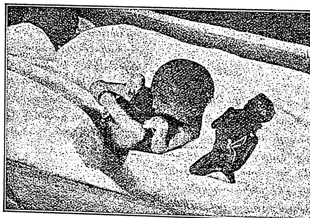
ՄՕՐ ԱՐԳԱՆԴԻՑ ՀԱՆՈՒՄԻ ՆՐՇՈՒՄՆԵՐ