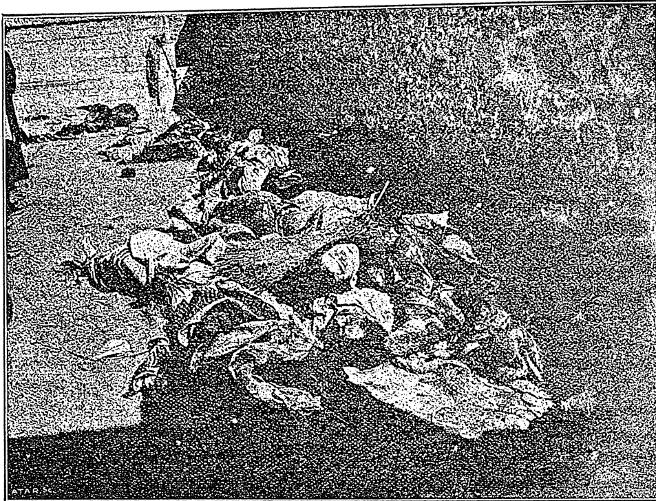
Փողոցի ՄԵՋ ԸՆԿԱԾ ԴԻԱԿՈՑՑ