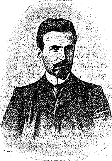
Բաղէշի Ծղակ դիւղում ծնւեց նա 1870 թ-ին: Գեու պատանի հասակում ուրիշ շատ հայրենակիցների հետ, նա ևս ձեռք առաւ պանդխտութեան գաւազանը և գնաց